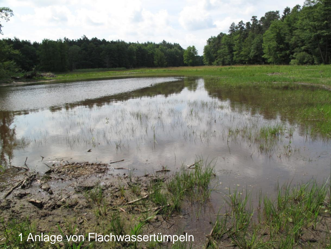
1 Anlage von Flachwassertümpeln