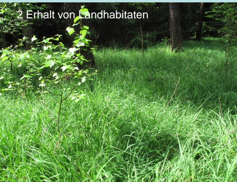
2 Erhalt von Landhabitaten