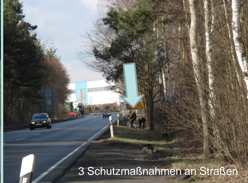
3 Schutzmaßnahmen an Straßen