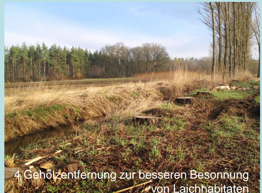
4 Gehölzentfernung zur besseren Besonnung von Laichhabitaten